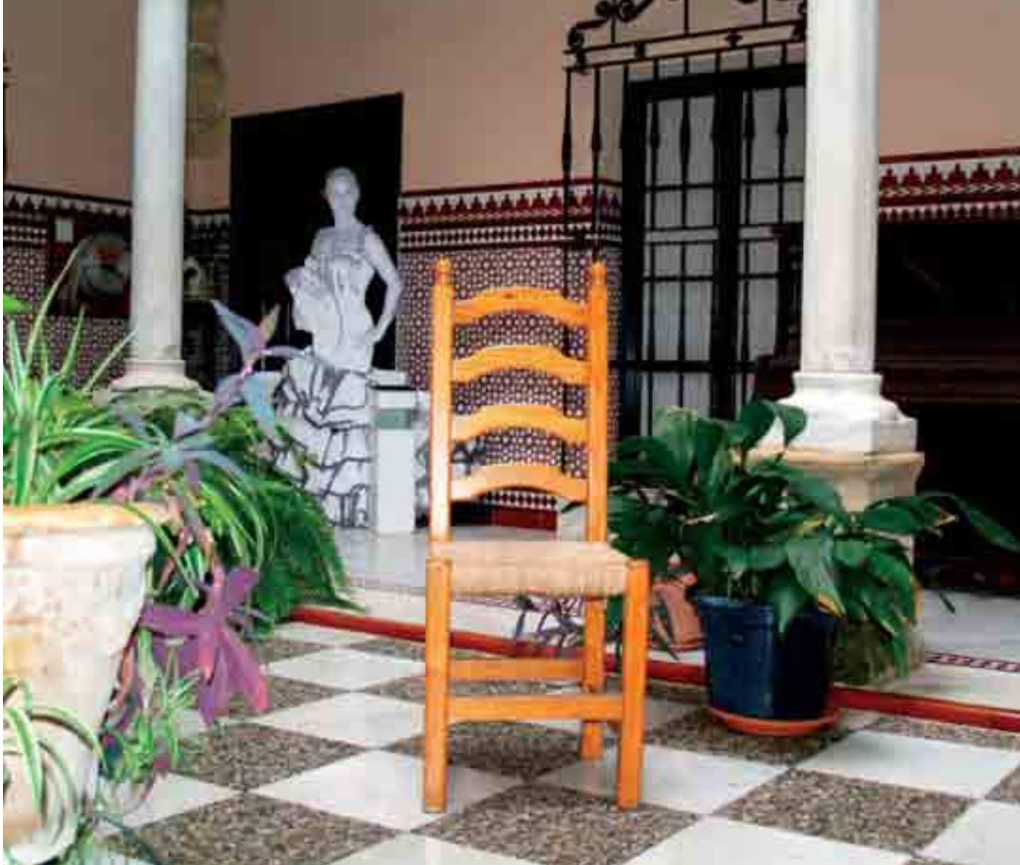
Patio del Centro Andaluz de Flamenco.

mente por la incorporación de algún aspecto formal en solitario, y cuando varios creadores lleguen al mismo resultado será un indicio de la solidez de los planteamientos de cada uno de los períodos (1).